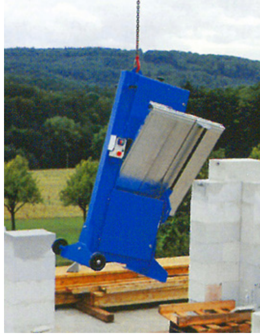
Gut erreichbare Transportöse Accessible transport lug