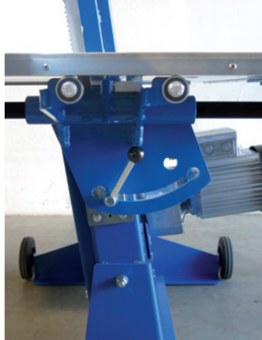
Gehrungswinkel-Anschlag Mitre square stop for bevel cuts