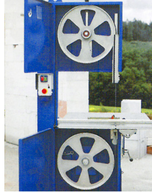
Sägerollendurchmesser 500 mm Saw wheel diameter 500 mm