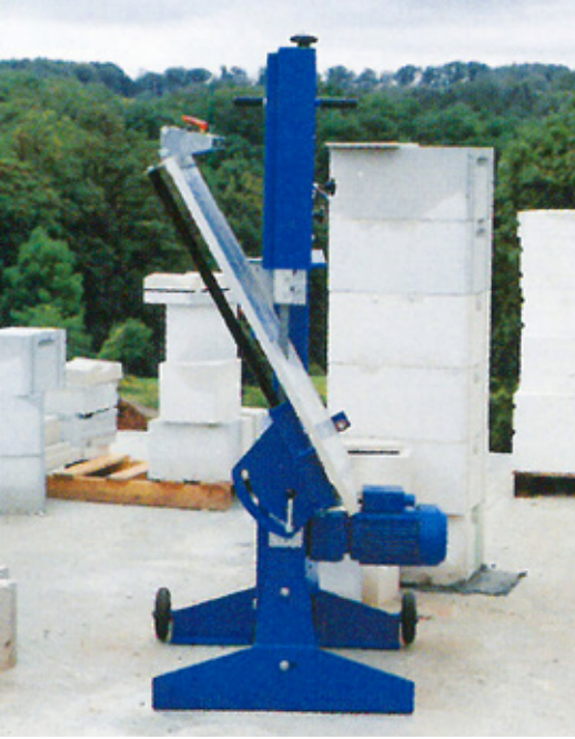
Praktische Transportstellung Practical transport position